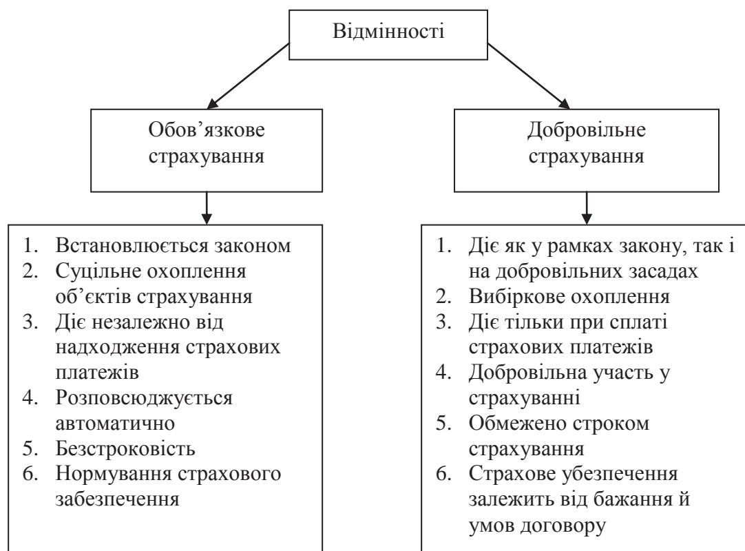
Рис.2. Законодавчі відмінності загальнообов'язкового і добровільного страхування.