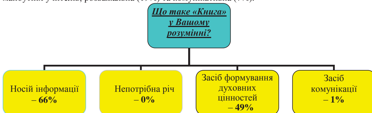
Рис. 5. Результати анкети «Книга у Вашому розумінні».

По-друге, опрацювавши дані анкетування студентів Донецького економіко-технологічного технікуму, можна зробити висновок, що для студентів технічного закладу, книга, перш за все, – це носій інформації, по-друге, засіб формування духовних цінностей, по-третє, засіб комунікації. Головне те, що жоден студент технічного закладу, як і педагогічного, не вважає книгу непотрібною річчю (Рис.5). Студенти економіко-технологічного технікуму вважають, що головна функція книги – це розвиваюча (75%), а вже потім освітня (61%) і виховна (27%). Другорядними функціями виступають, як і для майбутніх учителів, розважальна (19%) та комунікативна (7%).