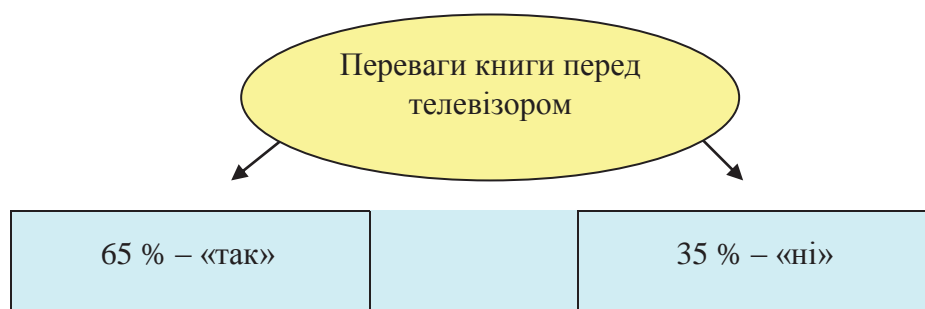
Рис.1. Переваги книги перед телевізором.

Більшість студентів педагогічного ВНЗ вважають, що у книги є перевага перед телевізором (Рис.1). Адже, придбавши книгу, можна деякі її сторінки швидко переглядати, інші читати повільно та вдумливо, аналізувати, повертатись до тих чи інших місць та сторінок декілька разів, щоб точніше все зрозуміти. І скільки б часу не минуло, завжди можна взяти потрібну книжку з полиці, щоб швидко відновити у пам'яті необхідну інформацію. Такі є переваги книги перед телевізором, глядач не може поки що замовляти телепередачі за своїм бажанням, подібно читачеві у бібліотеці.