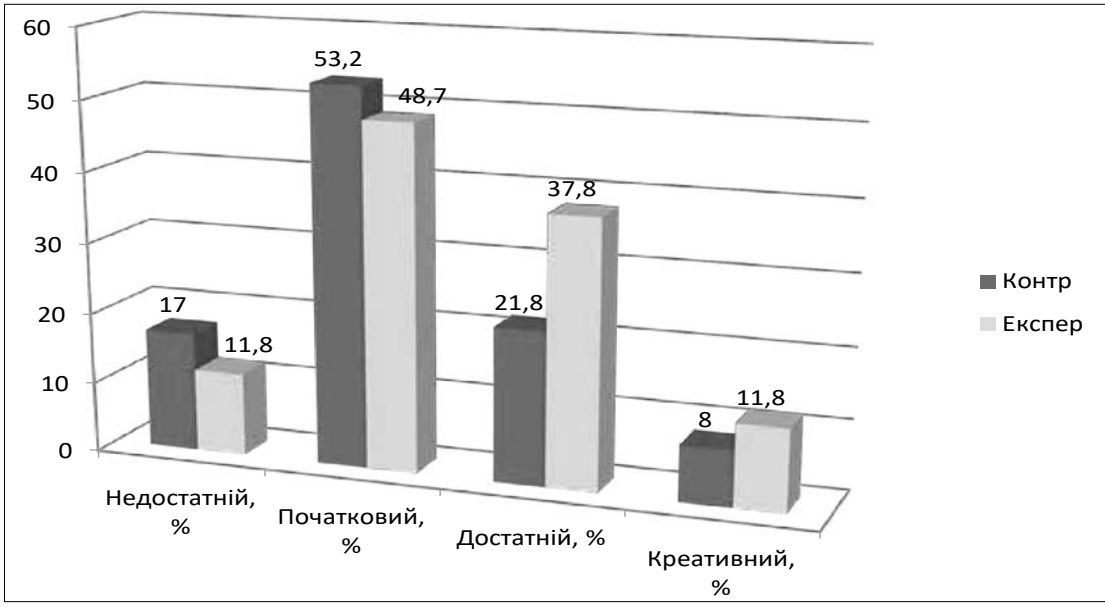
Рис. 2. Рівні когнітивно-інформаційного компонента громадянської активності студентів університету після завершення експерименту (%)