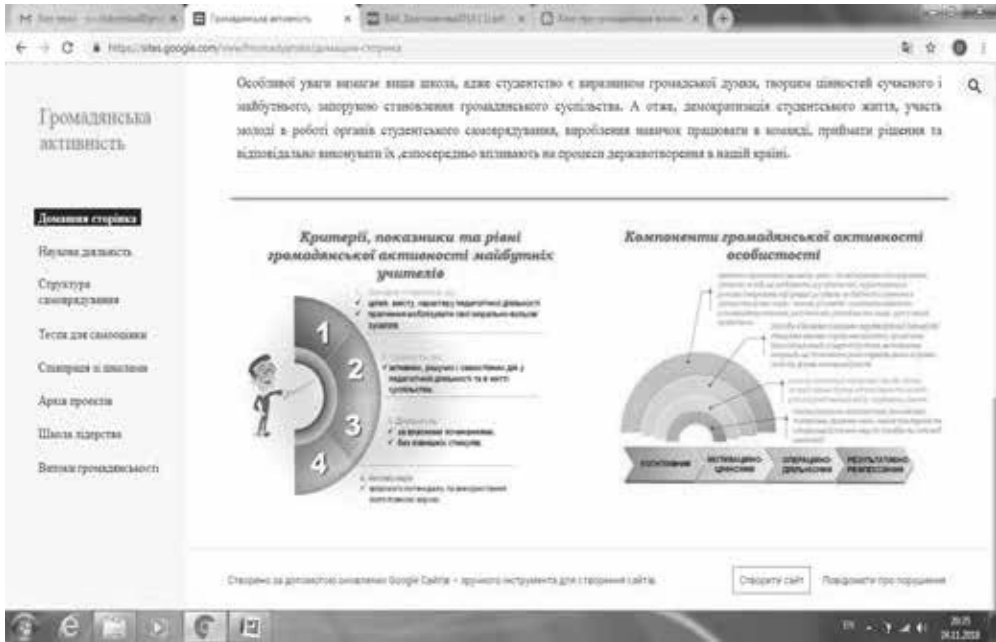
Рис. 1. Центральна сторінка авторського блогу стосовно громадянської активності студентів