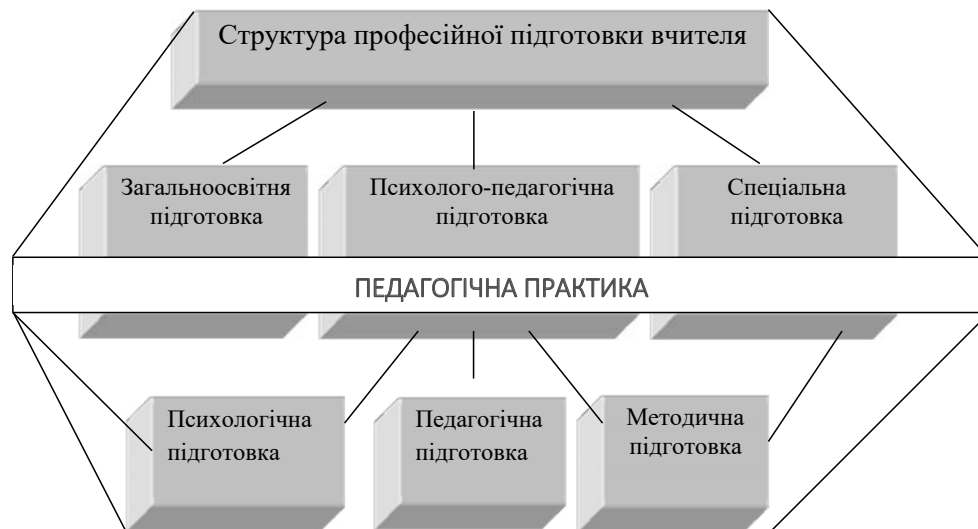
Рис. 3. Структура професійної підготовки вчителя початкових класів

для початкової школи) із декількох відносно самостійних підсистем, властивості, взаємозв'язки та взаємовпливи яких визначаються їх місцем у загальних межах системи більш високого порядку.