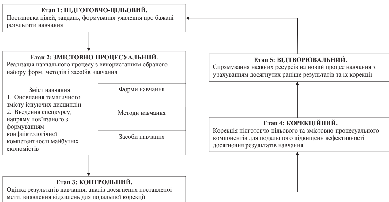
Рис. 1. Педагогічна технологія формування конфліктологічної компетентності майбутніх економістів у процесі вивчення гуманітарних дисциплін

Мета навчання визначається педагогами як образ майбутнього результату, представленого в певній системі образів [2, с. 106]; певна рушійна сила, що сприяє розвитку системи, її вдосконаленню [1, с. 104]; проміжна ланка між соціальним і методичним, детермінована об'єктивними потребами суспільства, виражаючи соціальне замовлення останнього [3, с. 102]; інтерпретація світоглядної позиції суспільства, зв'язувальна ланка між теорією і практикою [4, с. 74].