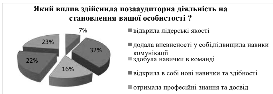
Рис. 3. Вплив позааудиторної діяльності на становлення особистості студентів

ності поняття «позааудиторна робота», на відміну від представників гуманітарних та економічних спеціальностей.