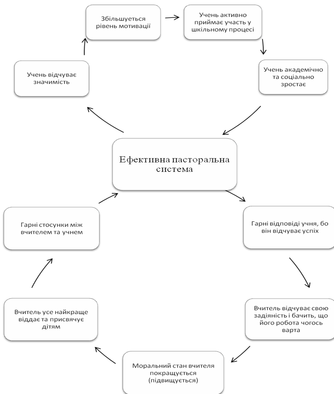
Рис. 2. Принцип дії ефективної пасторальної системи.

Саме тому у Великій Британії створено спеціальну організацію “National Association for Pastoral Care in Education” (NAPCE), яка піклується про створення ефективної виховної системи в школах та підтримку класних керівників. Члени цієї організації випускають журнал “Pastoral Care in Education” (“Пасторальна опіка в освіті”), який школи-члени даної асоціації отримують безкоштовно, а також створили свій веб-сайт ( http://www.napce.org.uk ), де всі, кому це цікаво та необхідно, можуть отримати додаткову інформацію з даного питання.