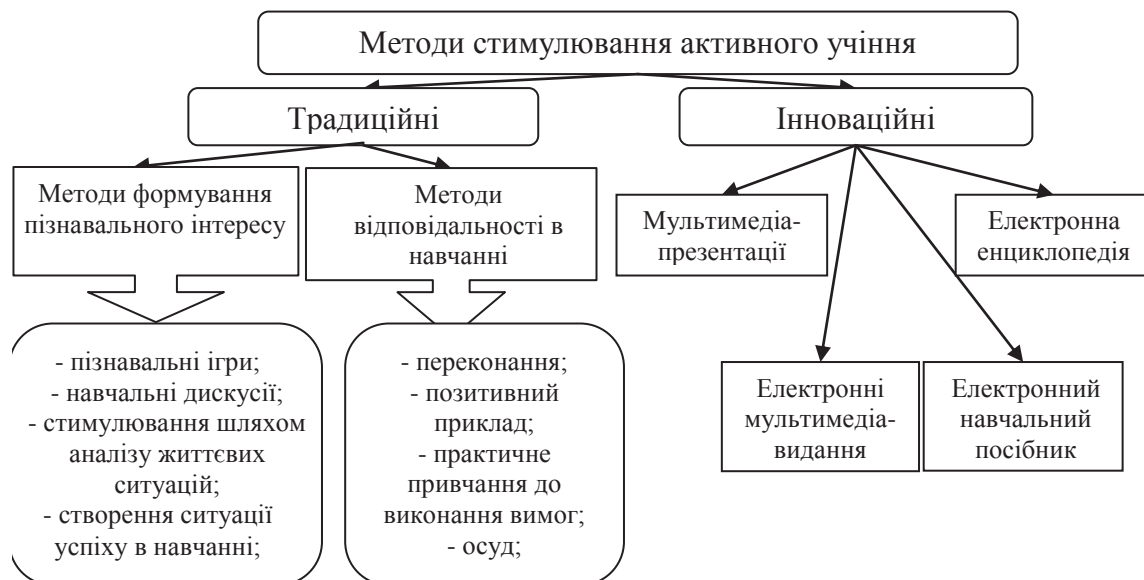
Рис. 3. Методи стимулювання активного учіння

Історично склалося, що всі методи стимулювання активного учіння можна поділити на дві великі групи: традиційні та інноваційні (рис. 3.).