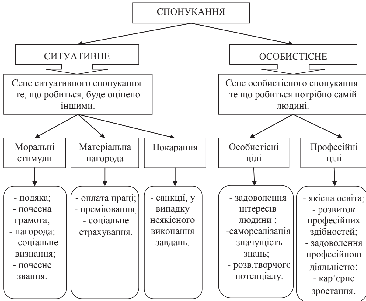
Рис. 2. Види спонукання

Спонукання ж - відчуття позиву. Спонукання - це сила, що штовхає нас щось робити, але залишає нам можливість вільного вибору. Спонукання може бути ситуативним і особистісним (рис. 2.). СENS ситуативного спонукання: те, що робиться, буде оцінено іншими. СENS особистісного спонукання: те що робиться потрібно самій людині.