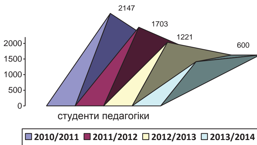
Динаміка студентів першого курсу напрямку Педагогіка на факультеті соціальних наук в Поморській академії в 2010-2013 рр., в числах

Головною зміною, яка пов'язана з реформуванням вищої освіти, вважається введення нової моделі навчання, передусім учителів. Ця модель передбачає надання більшої автономності вузам у побудові програм освіти після скасування "центральної" державних стандартів освіти напрямку Педагогіка (з 1.10.2012 р.), а також більшої свободи у створенні авторських напрямів та спеціальностей підготовки, що робить ВНЗ більш самостійним у визначенні предметів. Нові механізми опираються на вже функціонуючу в Європі систему кваліфікацій - так зване Національні рамки кваліфікацій (НРК), які є інструментом, що окреслює кваліфікації випускників з урахуванням особливостей польської освіти на основі ряду критеріїв і одночасно визначає якість професійної освіти, а також створює основу для порівняння рівня освіти з іншими європейськими країнами. Вважається, що в Болонському процесі ефекти навчання утворюють основний елемент загальноєвропейських рамок кваліфікацій, що робить можливим порівняння здобутих кваліфікацій студентів різних країн. Крім цього, на ефектах навчання ґрунтується поділ так званих "академічних" і "професійних" кваліфікацій.