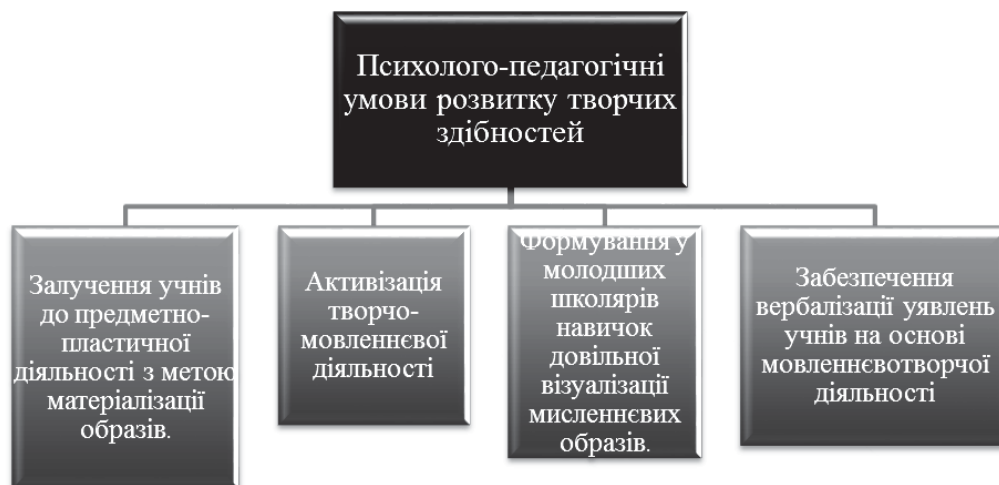
Рис. 1.1. Загальнопедагогічні умови розвитку творчих здібностей

У процесі мовної освіти творчий розвиток дітей пов'язують насамперед з мовленнєвою діяльністю. Так, зокрема, Н.Бондаренко, досліджуючи умови розвитку творчих здібностей молодших школярів у процесі мовленнєвої діяльності, до загальнопедагогічних відносить такі: педагогічне стимулювання, застосування психолого-педагогічних технологій, системність мовленнєвої роботи з учнями в умовах творчо-розвивального середовища [1] (див. рис.1.1).