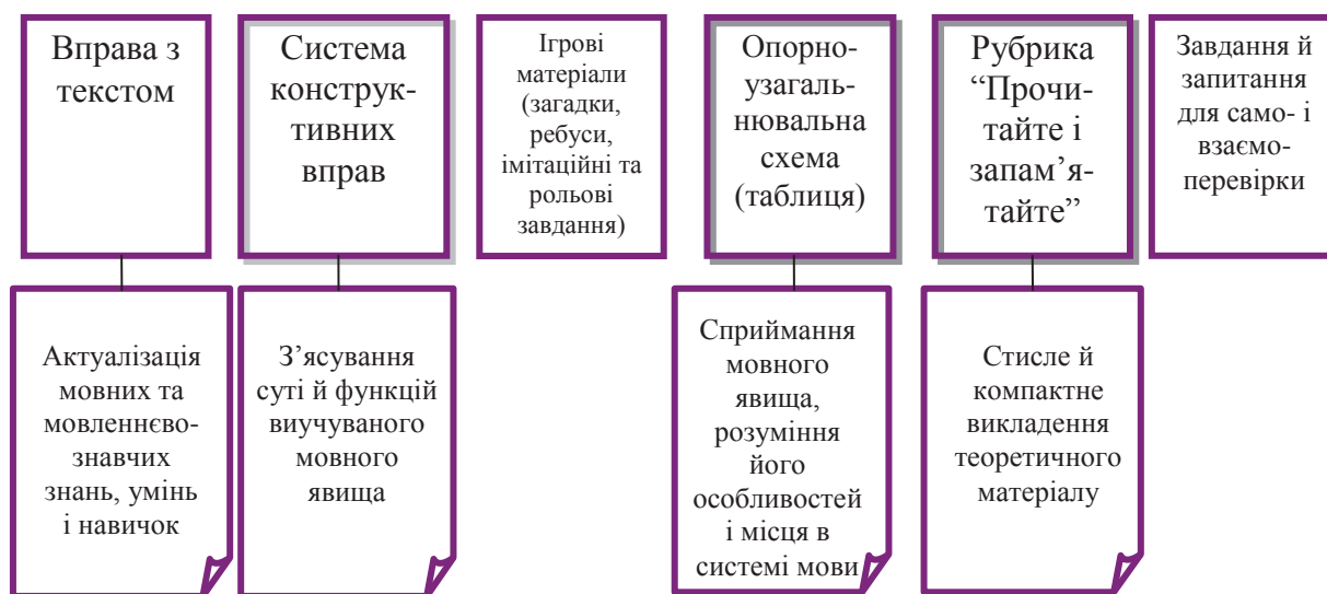
Рис. 1. Зміст і структура параграфів підручників української мови для 6-7 класів (за редакцією професора М. Пентиліук).

Згідно з класифікацією підручників А. Фурмана за характером викладу навчального матеріалу підручники української мови для 6-7 класів [3-4] є проблемно-дослідницькими. Це зумовлено логікою побудови змісту кожного параграфа (див. рис. 1), що передбачає проблемність і спрямованість на пошукову мисленнєву активність учнів, інваріантність і повноцінність, проектування проблемно-діалогічних засобів викладу навчального матеріалу з морфології тощо.