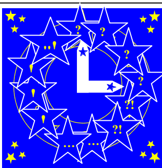
Рис.5. Результат роботи за прийомом малювання вільних уявлень члена тренінгової групи В.Козака на тему: “Наша група “ДО і ПІСЛЯ”

Практикувалися й професійно-зорієнтовані завдання, наприклад, створення “Клятви педагога”: “Клянусь: Жити! Творити! Світити щирим серцем і вільною душею в ім’я щасливого дитячого майбутнього!” (О.Варгатюк).