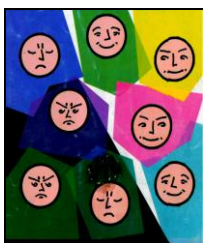
Рис.3. Малюнок кризової ситуації в тренінговій групі, виконаний О.Сауляк