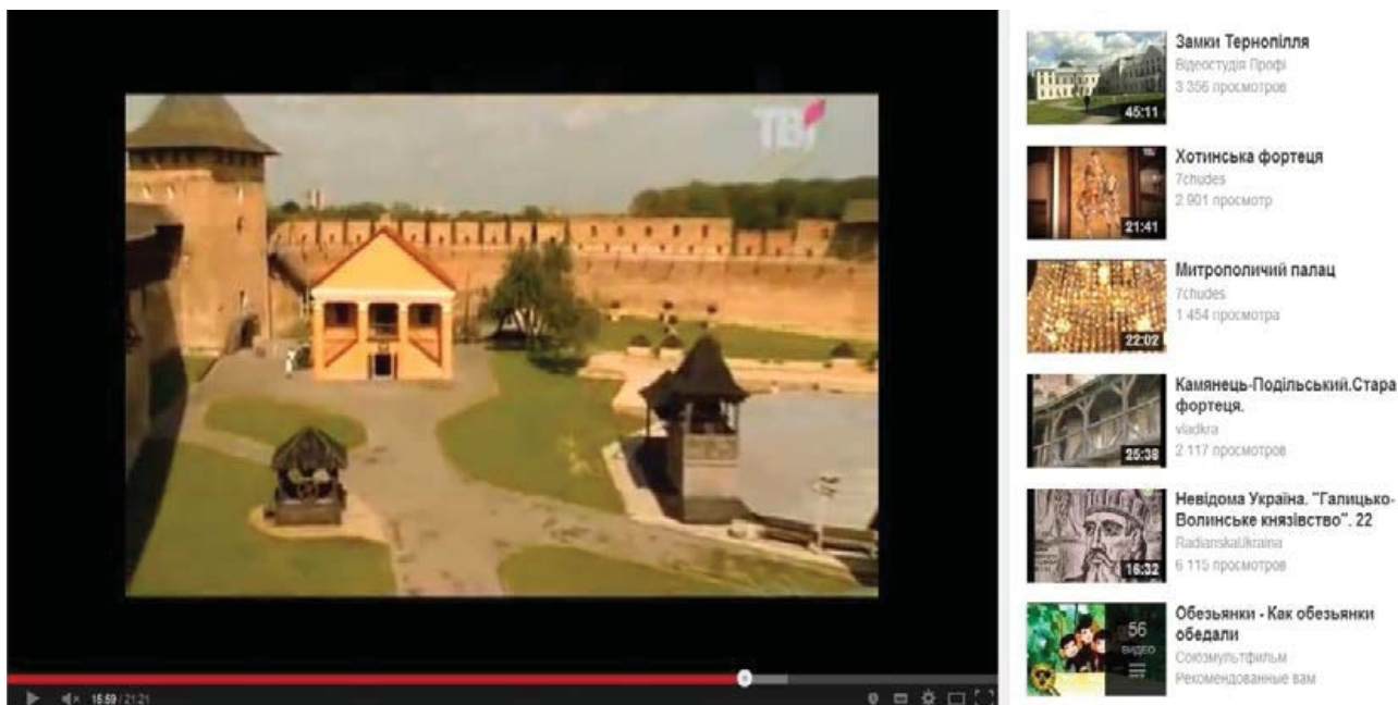
Рис. 1. Зразки використання відеоматеріалів при вивченні теми «Архітектурні пам'ятки історичної Волині»

У систему Moodle завантажені мультимедійні матеріали, що містять відео- та аудіо фрагменти. Аудіо- та відео матеріали – це робочі матеріали, які стануть у нагоді при вивченні тем «Екскурсійні маршрути», «Забуті архітектурні споруди» з дисципліни «Організація туризму» та