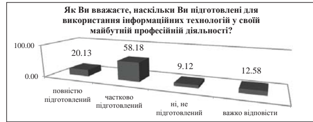
Рис. 3. Розподіл відповідей студентів, опитаних про те, наскільки вони підготовлені для використання інформаційних технологій у своїй майбутній професійній діяльності

На сьогодні активно використовуються глобальні комп'ютерні системи резервування, інтегровані комунікаційні мережі, системи мультимедіа, SMART Cards, інформаційні системи менеджменту та ін. (рис. 2).