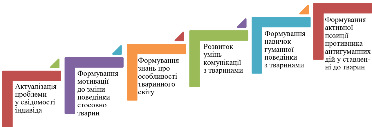
Рис. 2. Етапи формування гуманного ставлення до тварин

Через наявність констатованих фактів прояву жорстокого ставлення ми визначили зміни відповідно до поділу на три особистісні сфери, а саме когнітивну, психоемо-