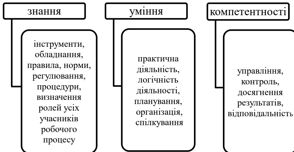
Рис. 2. Структурна кваліфікаційна рамка