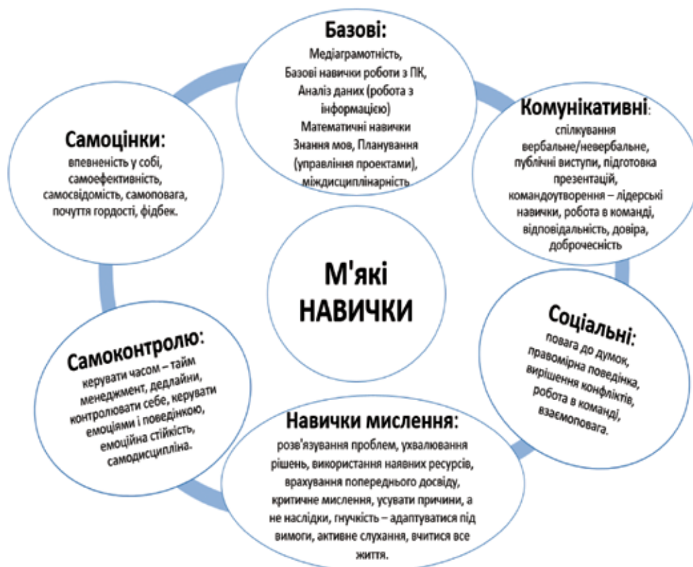
Рис. 1. Структура soft skills як база для формування у здобувачів передвищої освіти

Комунікативні навички. Це одна з найперших вимог, яка необхідна для ефектив-