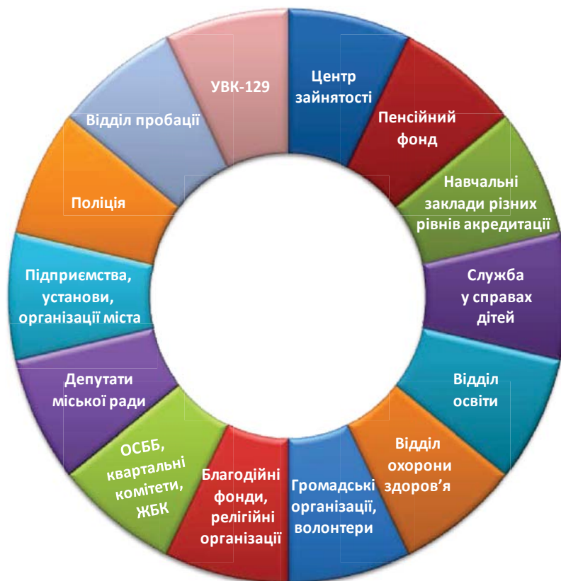
Діаграма 1. Взаємодія та співпраця фахівців соціальної роботи з відділами, управліннями та службами

Усі соціальні служби міста працюють на спільний результат. Нова модель роботи