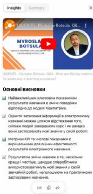
Рис. 2. Приклад обробки відео у застосунку Eightyfy [9]

ElevenLabs – це потужний інструмент для синтезу мови, який дає змогу перетворювати будь-який текст на високоякісне аудіо. Сервіс пропонує понад 120 варіантів голосів, що відрізняються за інтонацією, тембром і акцентом.