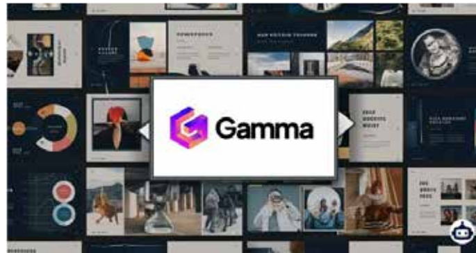
Рис. 3. Скріншот сторінки створення презентацій на платформі Gamma