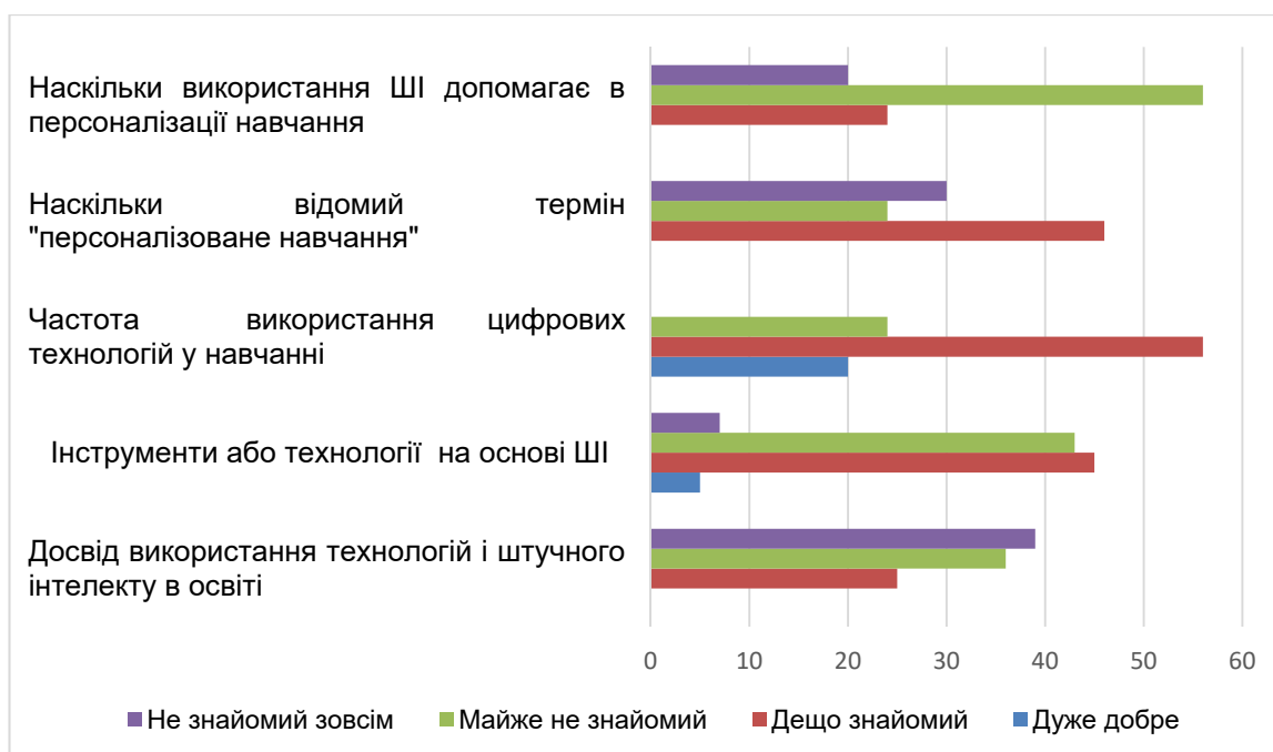
Рис. 1. Результати опитування щодо можливостей персоналізованого навчання засобами ШІ

завантажити відеофайл або вказати посилання на нього. Далі система автоматично генерує стислий опис відео, який може бути додатково налаштований користувачем. Функціональність інструменту дає змогу не лише отримати загальне уявлення про зміст відео, а й виді-