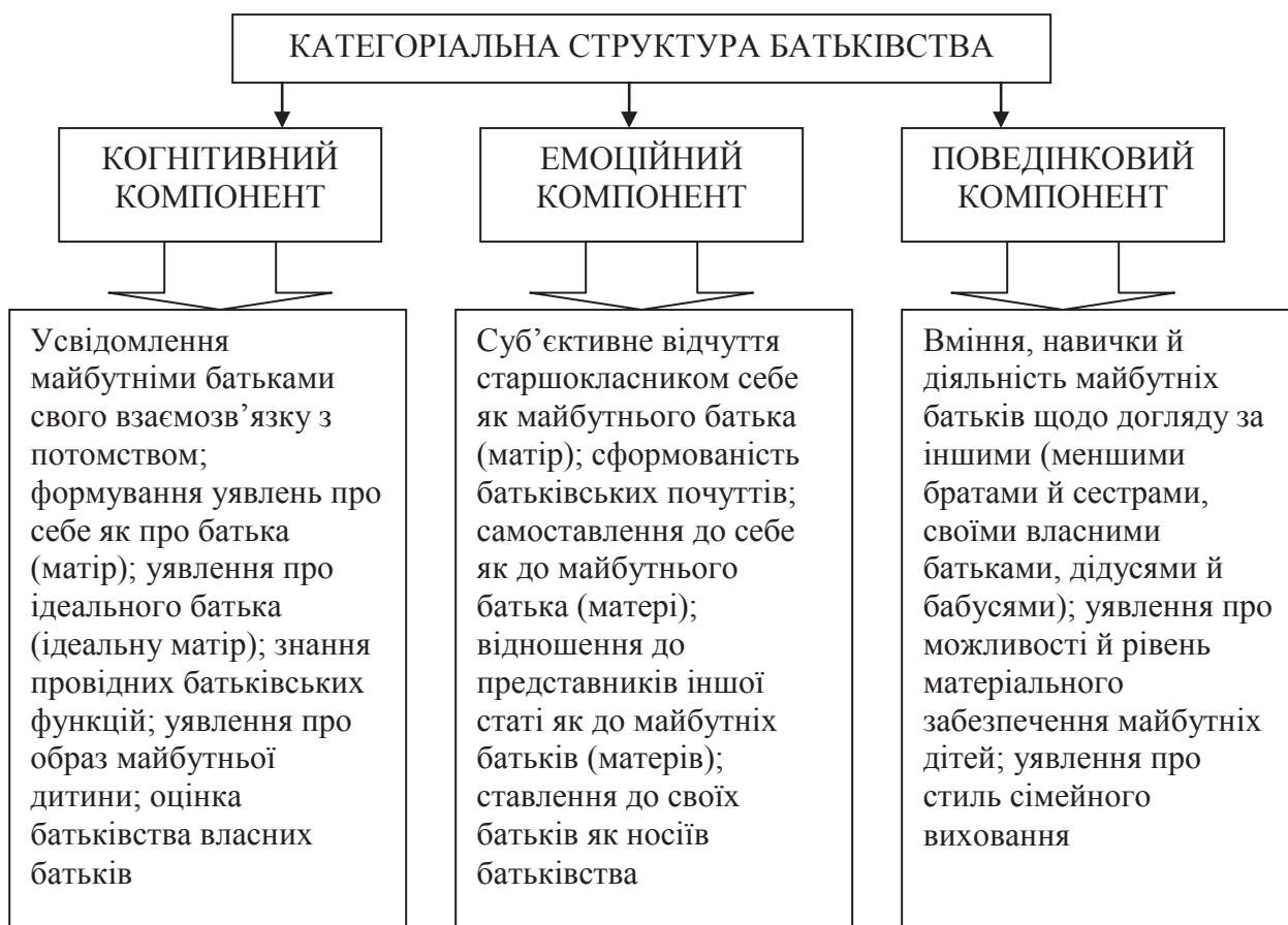
Рис.2. Компонентна структура батьківства.

Ґлибокий аналіз батьківства та відповідального ставлення до батьківства дає в своїй монографії Р.В.Овчарова [5: 12-24.]. Вона визначає батьківство як “інтегральне психологічне утворення особистості (батька чи матері), яке включає сукупність ціннісних орієнтацій батька (матері), установок і очікувань, батьківських почуттів, відношень і позицій, батьківської відповідальності і стилю сімейного виховання” [5: 12]. Як бачимо, у цьому визначенні батьківська відповідальність визначається як базова характеристика батьківства і його компонент. Вчена пропонує виокремлювати в структурі батьківства когнітивний, емоційний і поведінковий аспекти [5: 12], як це інтерпретовано нами на рис. 2.