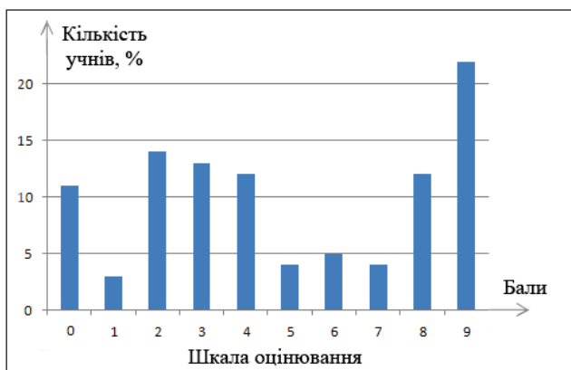
Рис. 5. Схильність учнів до вивчення гуманітарних предметів

Низький та високий рівні умінь учнів застосовувати набуті знання в практичній діяльності складають, відповідно, 28% та 25%. На основі наших досліджень можна зробити висновок про взаємозв'язок між пізнавальним інтересом до навчання фізики та практичними вміннями та навичками (рис. 6).