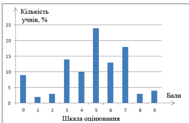
Рис. 6. Самооцінка практичних умінь учнів ремонтувати прості побутові прилади

Низький та високий рівні умінь учнів застосовувати набуті знання в практичній діяльності складають, відповідно, 28% та 25%. На основі наших досліджень можна зробити висновок про взаємозв'язок між пізнавальним інтересом до навчання фізики та практичними вміннями та навичками (рис. 6).