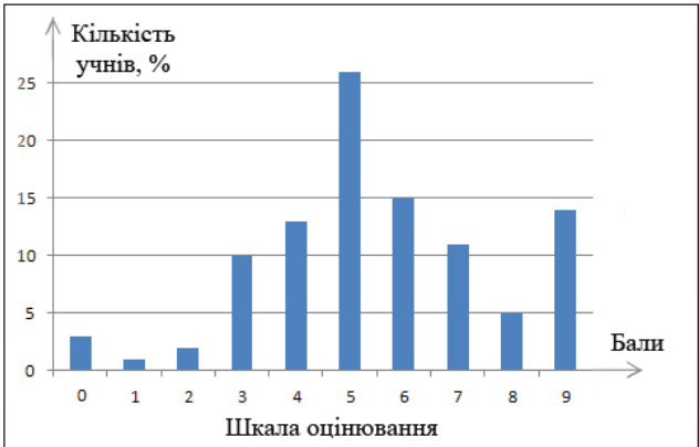
Рис. 3. Самооцінка учнів щодо рівня їх зацікавленості фізикою

Нами також було досліджено схильність учнів до вивчення природничих та гуманітарних наук. Результати анкетування показали, що 56% учнів оцінили свою схильність до природничих наук на середньому рівні. Низький рівень інтересу мають 35% учнів. Високий рівень схильності до вивчення природничих наук показали лише 9% учнів.