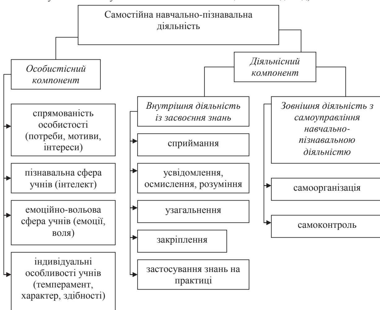
Рис.2. Структура самостійної навчально-пізнавальної діяльності.